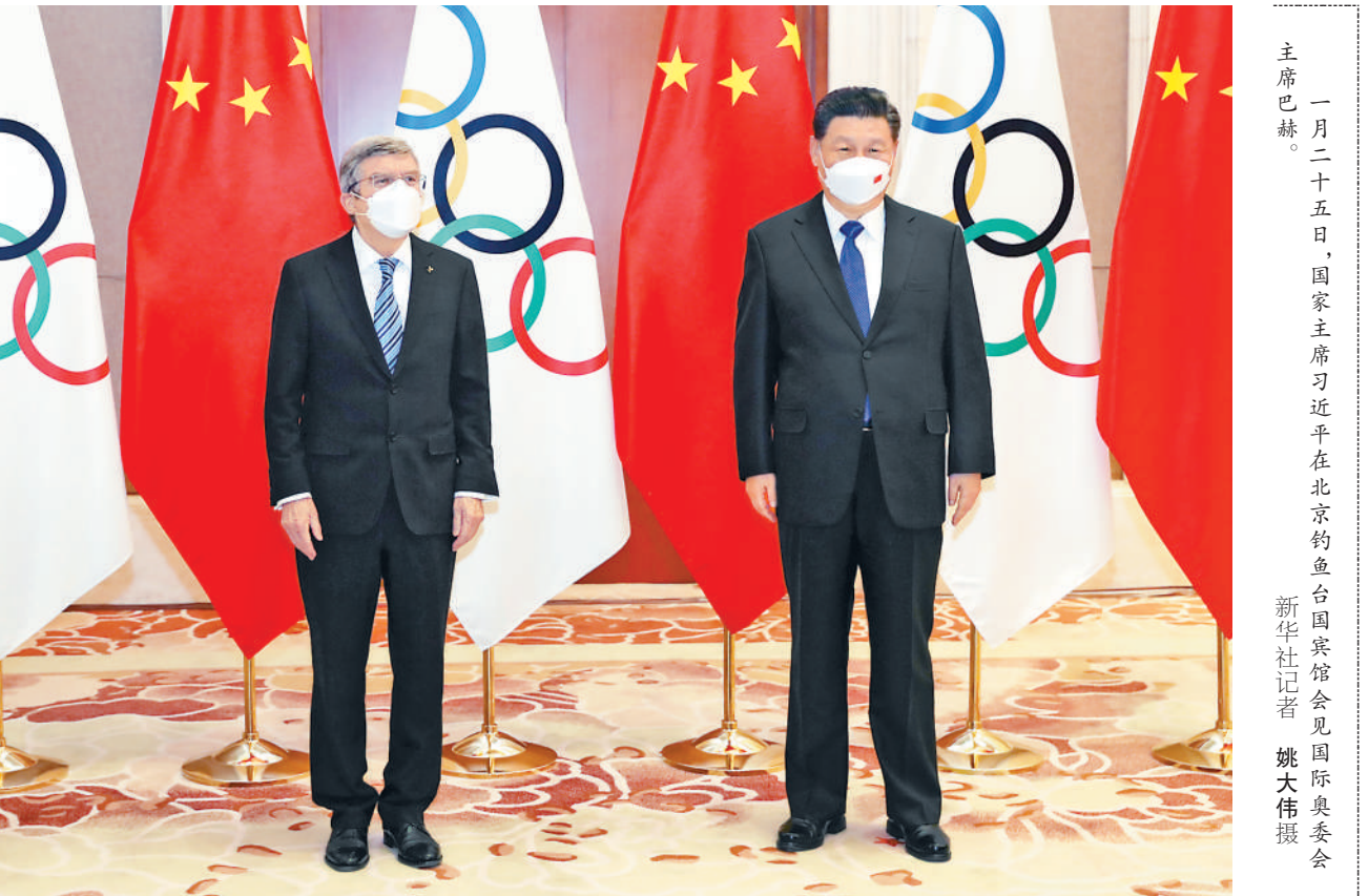
一月二十五日，国家主席习近平在北京钓鱼台国宾馆会见国际奥委会主席巴赫。

新华社北京1月25日电 国家主席习近平25日下午在北京钓鱼台国宾馆会见国际奥委会主席巴赫。 习近平表示，今天是中国农历小年，过几天就要过大年。欢迎你今年跟我们一起过年。 习近平指出，经过6年多筹办，北京冬奥会各项准备工作已经就绪，即将如期如约顺利举办。我们将兑现承诺，向世界呈现一届简约、安全、精彩的奥运盛会。这是新冠肺炎疫情发生以来首次如期举办的全球综合性体育盛会，是对“更快、更高、更强——更团结”奥林匹克格言的成功实践。 (下转第四版)