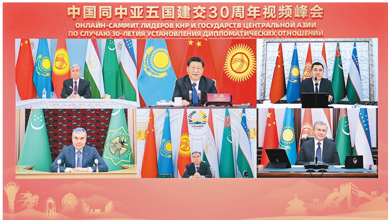
中国同中亚五国建交30周年视频峰会 ОНЛАЙН-САММИТ ЛИДЕРОВ КНР И ГОСУДАРСТВ ЦЕНТРАЛЬНОЙ АЗИИ ПО СЛУЧАЮ 30-ЛЕТИЯ УСТАНОВЛЕНИЯ ДИПЛОМАТИЧЕСКИХ ОТНОШЕНИЙ 1月25日下午，国家主席习近平在北京主持中国同中亚五国建交30周年视频峰会，发表题为《携手共命运 一起向未来》的重要讲话。哈萨克斯坦总统托卡耶夫、吉尔吉斯斯坦总统扎帕罗夫、塔吉克斯坦总统拉赫蒙、土库曼斯坦总统别尔德穆哈梅多夫、乌兹别克斯坦总统米尔济约耶夫出席峰会。