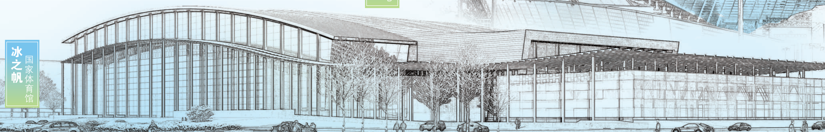
冰之帆 国家体育馆