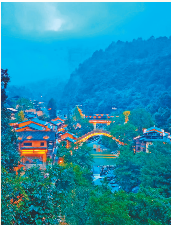
上图:村落一角。 右图:山谷人家。 欢迎投稿,邮箱:findzmc@163.com。

望仙乡传承赣东北民居传统建筑形制和构筑手法,依托原有民居,对村落全面升级。就地取材,以大面积的夯土墙、碎石墙搭配木质小窗,质朴素雅。如今的望仙乡,早晚清风徐徐,树木枝叶摇曳生姿,黄墙黛瓦在阳光照耀下,宛如一幅岁月静好的山居图。很多人慕名而来,尝一口“灯盏糕”,看一出赣戏,在古戏台下品一品百味人生;玩一次漂流,在峡谷中体验速度与激情;住一晚乡村民宿,感受山野趣味……文化和旅游产业深度融合,乡村活了起来,也火了起来。