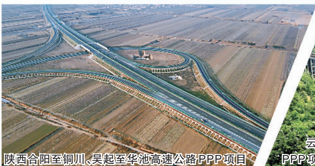
陕西合阳至铜川、吴起至华池高速公路PPP项目

近年来，PPP模式在加强基础设施补短板、调结构、惠民生等方面发挥了显著作用。财政部政府和社会资本合作中心（简称“财政部PPP中心”）数据显示，截至2021年11月底，PPP管理库累计入库项目10209个，投资额16.1万亿元。累计落地项目涉及市政工程、交通运输、生态建设和环境保护、城镇综合开发、科教文卫体旅等领域。PPP模式作为政府与社会资本在基础设施和公共服务领域开展的长期合作模式，随着在全国各地的深入实践，目前已呈现出进一步规范化、理性化的发展态势。