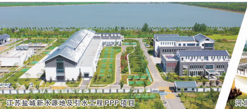
江苏盐城新水源地及引水工程PPP项目