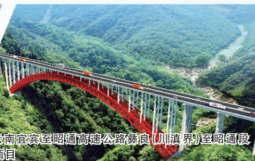
云南宜宾至昭通高速公路彝良（川滇界）至昭通段PPP项目

2016年3月4日，经国务院批准，中国政企合作投资基金股份有限公司（简称“中国PPP基金”）成立，注册资本1800亿元。成立5年多来，在财政部、国家发改委等部门的指导下，中国PPP基金始终紧密围绕国家重大战略，专注于PPP项目投资，持续发挥“引导、规范、增信”作用，规范引导更多社会资本参与基础设施和公共服务领域的投资。