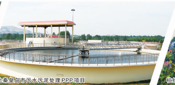
河北秦皇岛市污水污泥处理PPP项目