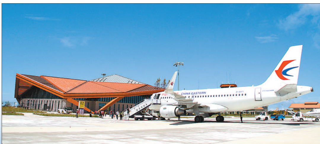
图①:甘南夏河机场附近景色。 成都小队队长摄(人民视觉) 图②:稻城亚丁机场外景。 姜曦摄(人民视觉) 图③:甘孜康定机场,飞机准备起飞。 成都小队队长摄(人民视觉) 图④:秋季的迪庆香格里拉机场鲜花簇拥。 叶传增 李谨摄影报道 图⑤:神农架红坪机场,乘客正在登机。 神农架林区民航事业发展中心供图 图⑥:甘孜格萨尔机场一角。 王永战 李丽莎摄影报道 本版责编:肖潘潘 张佳莹 杨烁壁 版式设计:张芳曼