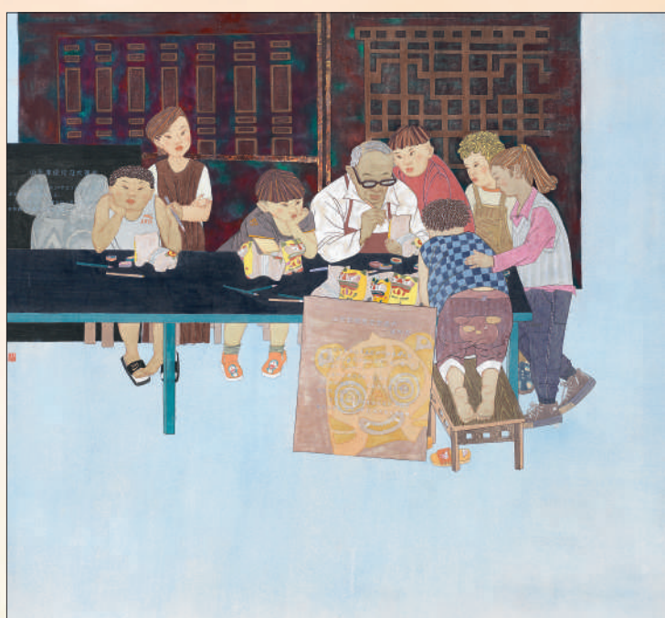
图①:管建新、管建林油画《民生建设——暖心千万家》局部。 图②:孙陶中国画《幸福里》。 图③:赵彤中国画《匠心·传承》。 图④:周乐中国画《温暖如故》。