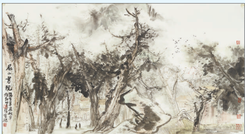
尼山书院(中国画) 张宝珠