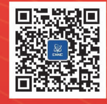
关注中核集团， 回复“中核日”即可参加活动

1955年1月15日,是中国核工业的创建日,从“开业之石”到实现“两弹一艇”惊世伟业,从“国之光荣”到铸造“国家名片”,核工业为筑牢国家安全基石、挺起民族脊梁作出了突出贡献。 中核集团将1月15日确立为集团公司主题文化建设日,目的是为了时刻铭记核工业的创业初心,以奋进之姿永葆强核报国之志,以躬身之为锻造成事之功,共担祖国核事业这项光荣的使命,共圆核工业强国这个宏伟的梦想。 从1955年创建至今,中国核工业已经走过67年,梳理发展脉络,可分为三个30年。