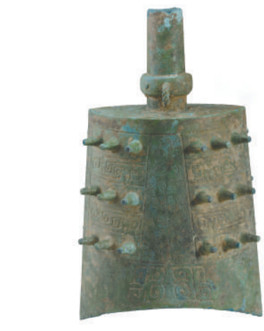
▲万福垱遗址出土楚季宝钟。

通过地图，观众可以看到楚国疆域不断扩大的过程。《史记》《左传》等文献，与包山楚墓出土的“楚先老僮、祝融、鬻熊”等简文、清华《楚居》简、周原出土的“楚子来告”甲骨文等相互印证，夯实了楚国在西周早期立国的事实，同时使得楚立国之初当在汉水之南、江汉沮漳地望的