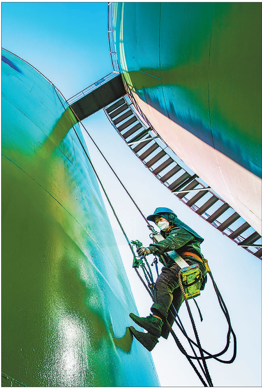
近日，国家能源集团江西丰城电厂顺利完成1、2号除盐水箱共1600平方米防腐补漆工作。图为检修作业人员对除盐水箱进行刷漆防腐作业。

“习近平总书记的话深深铭刻在我们团队每一个人的心底，将激励我们继续弘扬科学精神，勇攀深海科技高峰，为加快建设海洋强国、为实现中华民族伟大复兴的中国梦而努力奋斗，为人类认识、保护、开发海洋不断作出新的更大贡献。”叶聪说。