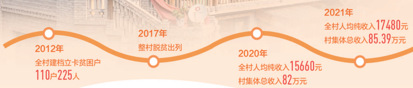
骆驼湾村脱贫致富相关数据