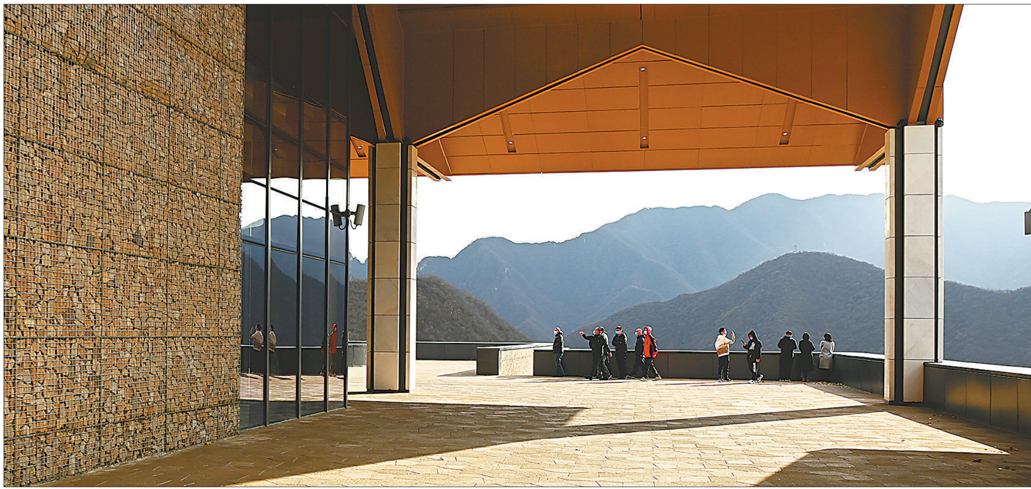
图⑧：张家口冬奥村(冬残奥村)的居民服务中心。