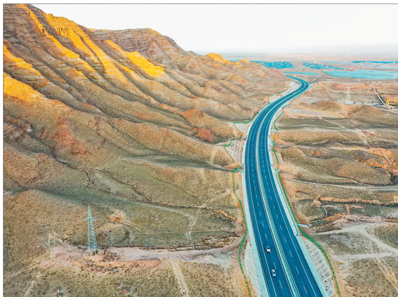
12月29日,乌玛(内蒙古乌海市至青海玛沁县)高速宁夏青铜峡至中卫段正式通车。至此,宁夏高速公路通车里程达2068公里。乌玛高速途经内蒙古、宁夏、甘肃、青海4省区。宁夏青铜峡至中卫段主线全长122.9公里,其中18公里穿越腾格里沙漠腹地,是宁夏建设的首条沙漠高速公路。

本次论坛以“融合汇聚,共创美好”为主题,由中央网信办、人民日报社指导,人民日报社新媒体中心、人民日报智慧媒体研究院承办。参加论坛的还有文化和旅游部、国家乡村振兴局负责同志,部分中央新闻单位新媒体部门、中央新闻网站、互联网企业负责人,以及专家学者代表。