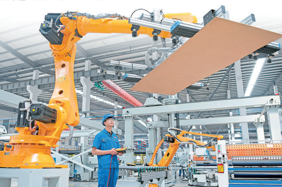
位于江苏海安市的跃通数控有限公司车间内,员工正在调试自动化生产设备。

“随着一系列政策举措落地见效和市场需求逐步恢复,企业家对未来发展预期保持谨慎乐观。”国务院发展研究中心公共管理与人力资源研究所所长李兰说,调查显示,企业家预计未来订货有所恢复,产品价格下跌压力降低,盈利趋于改善,用工和投资计划保持稳定,企业综合经营状况有望改善。