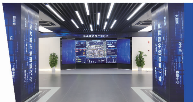
浙江联通信息化展厅