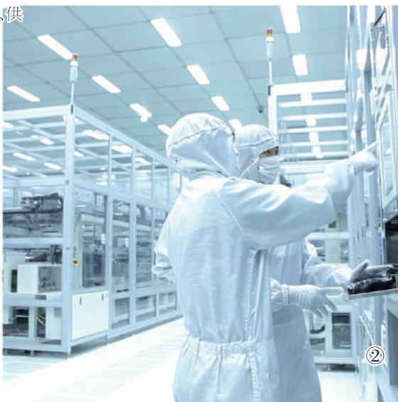
图①、图②、图③：企业现场质量管理。资料图片

质量既是产出来的，也是管出来的，同时也是市场竞争出来的。质量整体水平的提升，既需要各类市场主体作为供给方，绵用力、见思思齐，也需要全社会、各行各业和广大消费者作为需求方共同监督、择优弃劣，更需要政府加强监管、积极引导。