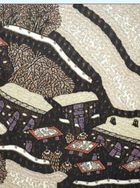
►溪声犹带夜来雨(中国画) 朱道平