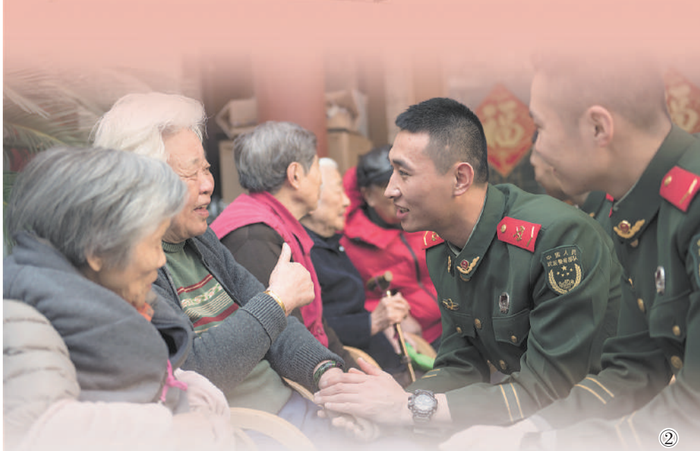
图②：武警上海总队执勤第四支队执勤十中队官兵在黄浦区老年公寓看望老人。