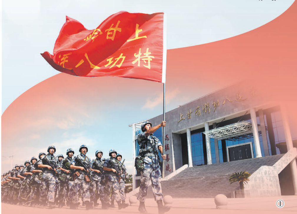
图①：“上甘岭特八连”高举战旗。