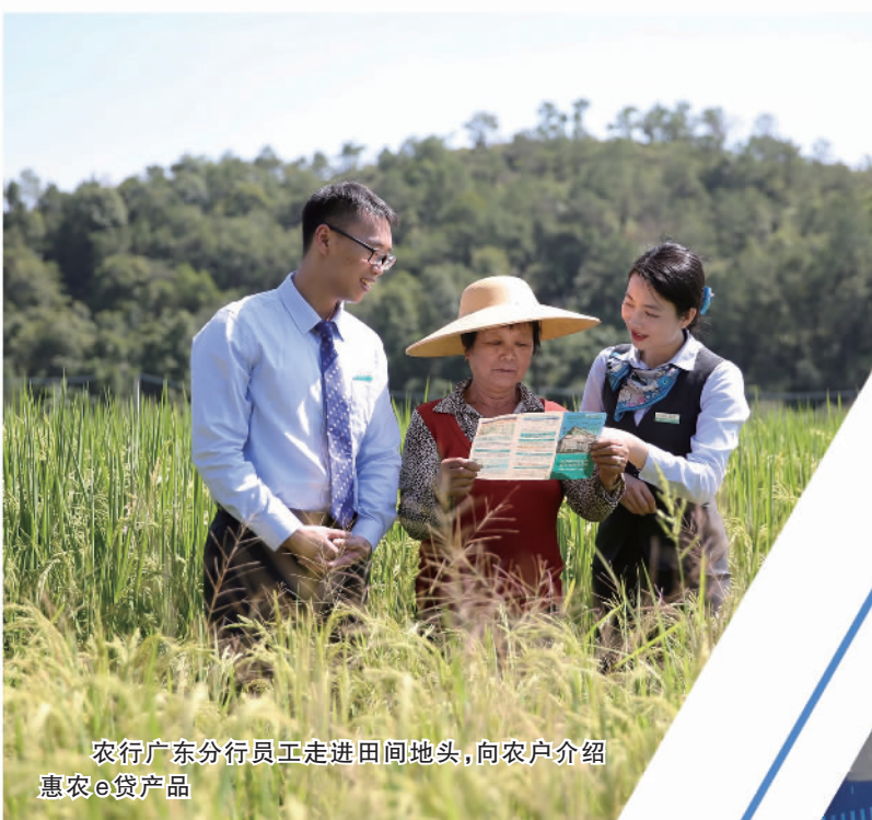
农行广东分行员工走进田间地头，向农户介绍惠农e贷产品