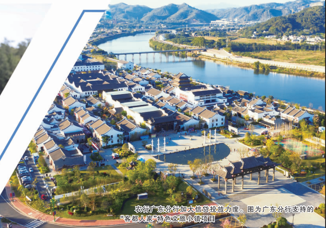
农行广东分行加大信贷投放力度。图为广东分行支持的“客都人家”特色文旅小镇项目