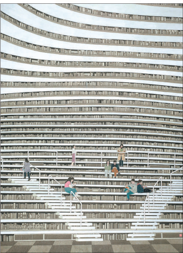
▲学海无涯(中国画) 任凤茗

还有一些美术作品，并不直接表现或刻画参与文化活动的群众，而是以巧妙构思、独特视角展现出中华优秀传统文化本身的吸引力。像孙娟娟中国画《对话》，以富有朦胧之美的语言，展现博物馆一角。画面正中，玻璃展柜里的青铜器引人注目，一位小女孩正望着文物沉思，各国游客则聚集在她周围，对着文物拍照。简洁而细腻的画面，无声地展现出传统与现代、