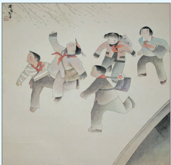
▲上学图(中国画) 杨刚

研究和创作成果。100余幅中国画、书法作品，创作年代跨越近30个春秋，充分体现出这位87岁的学者对艺术与学术不懈探索的精神。后者全面回顾了北京画院画家杨刚的艺术人生。150余幅作品从不同角度展现了画家深入草原的生活体验，在中国画、油画、版画、速写等领域的成果，以及返璞归真的艺术追求。在北京画院美术馆，“居幽采真——北京画院园林主题作品展”缓缓展开，60余件中国画、油画作品，以当代视角表现传统园林，形成多元化、个性化的园林绘画面貌，展现了当代美术工作者对传统绘画题材的新思考。笔墨墨韵之间，艺术的魅力熠熠生辉，为时代留下丰厚的精神印记。(画间语)