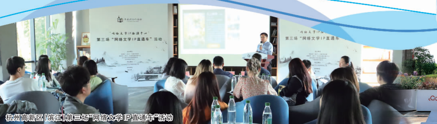
杭州高新区(滨江)第三场“网络文学IP直通车”活动