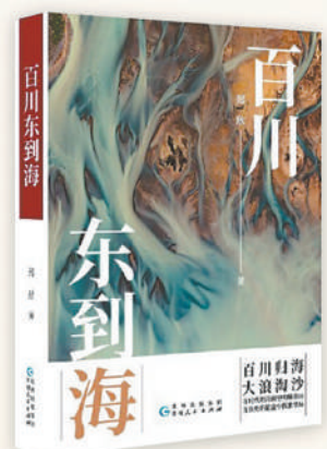
《百川东到海》:郑欣著;贵州人民出版社出版。

《百川东到海》主题正大,革命前辈的浴血奋斗和巨大牺牲令人动容;小说的样貌又是细腻的,人物、故事、情境生动可感。作为伟大建党精神的文学呈现,《百川东到海》通过时代与人物命运的纵横交织,凸显了大浪淘沙、百炼成钢的历史意蕴,彰显了中国共产党的中流砥柱的历史规律和历史必然。