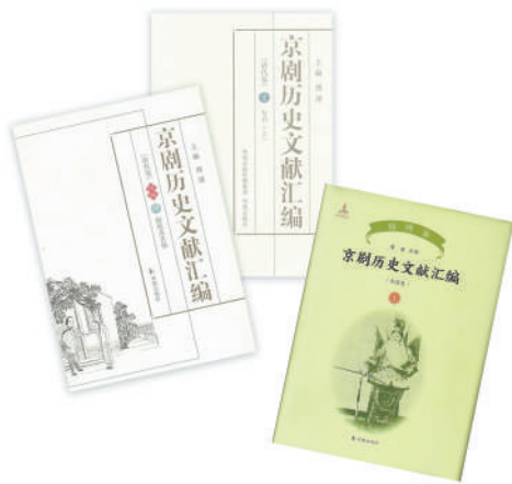
《京剧历史文献汇编》:傅谨主编;凤凰出版社出版。

京剧研究是一个庞大的学术工程,需要众多学者群策群力,文献资料的搜集整理是其中一个不可替代的环节,也是基础性工作。文献资料的搜集整理没有止境,永远在路上,更全、更完备、更完善、更方便实用,这是研究者永远的追求。《京剧历史文献汇编》为整理京剧文献做出了良好示范,希望有更多研究者继续努力,将期刊、图像、文物等各类文献进行全面系统的整理,循序渐进,不断夯实京剧研究的文献基础。