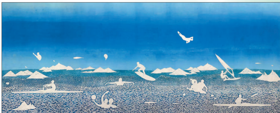
▲ 同一天空下(版画) 罗小颜 陈煜壁 ▲ 晨练局部·中国画 版式设计：蔡华伟 李长兴