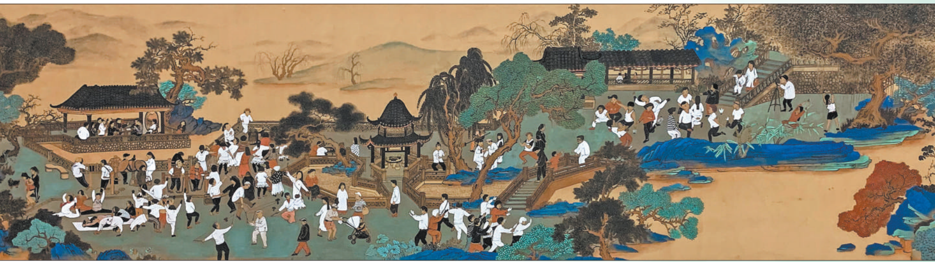
► 春风吹梦到江南(中国画) 唐建 ▲ 冬日月沼(油画) 宛少军