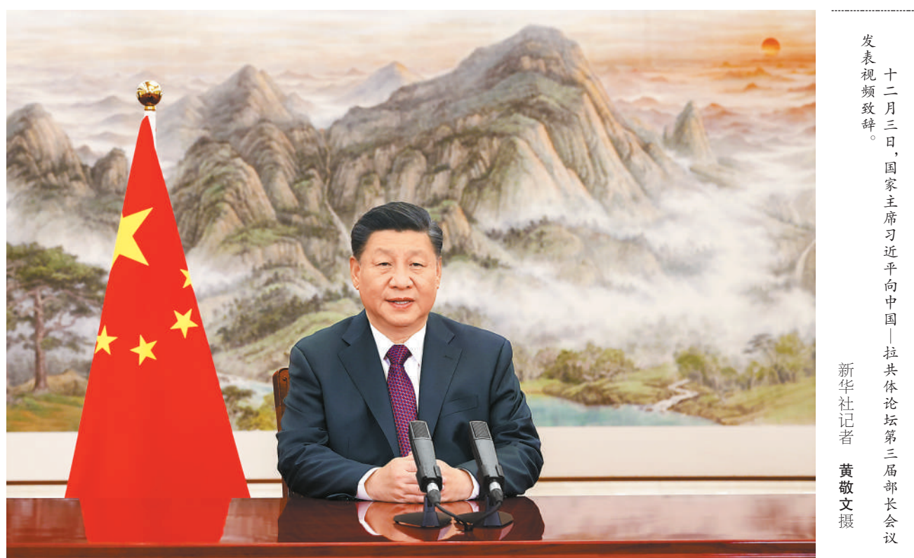
十二月三日,国家主席习近平向中国—拉共体论坛第三届部长会议发表视频致辞。

新华社北京12月3日电 2021年12月3日,国家主席习近平向中国—拉共体论坛第三届部长会议发表视频致辞。 习近平指出,中国—拉共体论坛成立7年来,双方本着加强团结协作、推进南南合作的初心,将论坛打造成双方互利的主要平台,推动中拉关系进入平等、互利、创新、开放、惠民的新时代。 习近平强调,当今世界进入新的动荡变革期,中拉都面临着推动疫后复苏、实现人民幸福的时代新课题。欢迎拉方积极参与全球发展倡议,同中方一道,共克时艰、共创机遇,共同构建全球发展命运共同体。 习近平强调,历史告诉我们,和平发展、公平正义、合作共赢才是人间正道。中拉同属发展中国家,是平等互利、共同发展的全面合作伙伴,独立自主、发展振兴的共同梦想把我们紧紧团结在一起。让我们共同谋划中拉关系蓝图,增添中拉合作动力,为增进中拉人民福祉和人类进步事业作出新贡献。