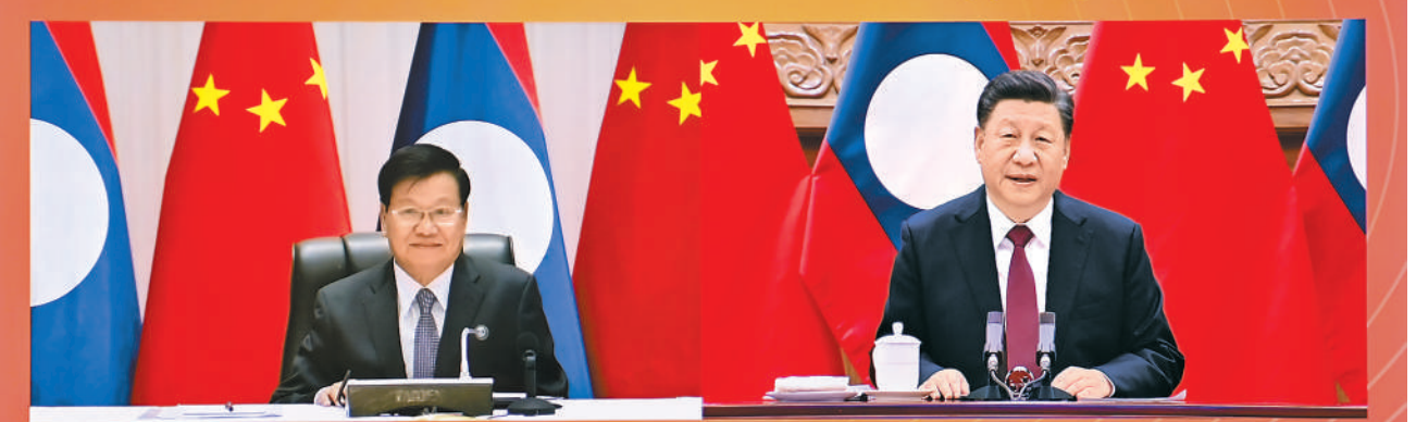
12月3日,中共中央总书记、国家主席习近平在北京同老挝人民革命党中央总书记、国家主席通伦举行视频会晤。

本报北京12月3日电 (记者杨迅)中共中央总书记、国家主席习近平12月3日同老挝人民革命党中央总书记、国家主席通伦举行视频会晤。 习近平指出,今年是中老建交60周年暨中老友好年。60年来,中老关系之所以能够经受住国际风云变幻考验,历久弥坚、历久弥新,关键在于双方坚守共同理想,彼此信赖、守望相助、命运与共。 习近平强调,中老都坚持共产党领导和社会主义方向,这是两国关系的本质特征。面对复杂严峻的外部环境以及各自国内艰巨的疫情防控和经济社会发展任务,中老要站在维护社会主义共同事业的战略高度,推动两党两国关系不断迈上新台阶,持续构建牢不可破的中老命运共同体。 双方要共同维护中老政治和制度安全。中方愿与老方加强战略沟通,深化治国理政经验交流,为老挝国家建设事业提供力所能及的支持和帮助。双方要发挥好中老经济走廊合作联委会综合协调作用,统筹推进中老务实合作,推动共建“一带一路”高质量发展,不断提升务实合作水平。中老铁路今天通车运行,老挝成为“陆联国”的梦想即将成为现实。我们不仅要实现“硬联通”,还要抓好“软联通”,做好铁路后续运维和安全保障,打造高质量、可持续、惠民生的沿线经济带。要推进新型基础设施项目合作,提升中老能源互联互通水平,加强农业、经济开发、金融等领域合作。 习近平强调,为人民服务是中老两党的共同宗旨。(下转第四版)