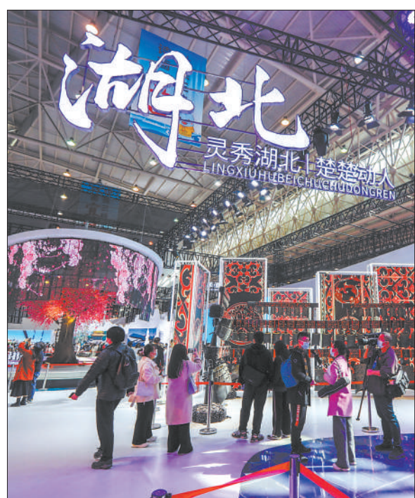
游客在灵秀湖北展区驻足参观。

荆门馆以色彩鲜艳的滑翔伞和热气球为创意设计,寓意荆门人穿越云海、拥抱蓝天的“追梦人”形象。红黄交错的滑翔伞造型吸引观众前来拍照,小朋友们站在热气球旁不愿离开。场馆放大荆门市体育休闲旅游特色,400平方米的场馆内,“一箭钟情”“一伞浪漫”“一网情深”三个主题勾勒出荆门运动休闲旅游的独特魅力,游客可以在教练指导下现场进行射箭游戏、滑翔器体验等互动游玩项目。