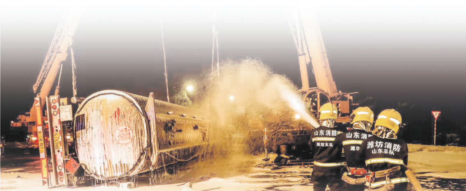
国家综合性消防救援队伍 组建3年来

2020年9月,北京市开展“一警六员”基层一线人员消防基本技能实操实训,对社区居民警、镇街工作人员、安全生产巡查员等基层工作者进行实操实训,让他们不仅能快速扑救