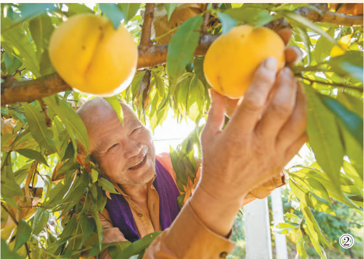
图①：雾中孙村。图②：喜获丰收。

北望长江、地处皖南，在安徽省芜湖市繁昌区孙村镇，山峦峰林、阡陌田园与村庄民舍相互交错，在云雾中若隐若现，让人仿佛置身画卷。 孙村镇所处区域地貌类型多样，山河、圩、滩兼有，土地肥沃，气候宜人，拥有马仁奇峰、红花山等景区，吸引远方的游人一睹皖南美景。近年来，孙村镇以“转型发展、强镇富民”为主线，加快建设实力、活力、魅力新孙村，被评为全国文明村镇、全国环境优美乡镇、全国特色小镇。