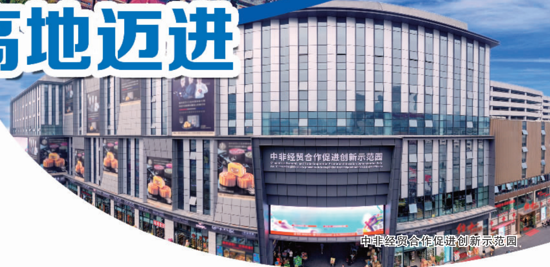
中非经贸合作促进创新示范园

从株洲中车物流基地出发，“湘粤非”铁海联运可以让货物直接从湖南送抵非洲、亚太、中东、拉美等区域内陆，一票直达；中欧班列（长沙）直通亚欧，怀化国际陆港建设如火如荼……“十三五”时期，湖南省进出口总额年均增长21.7%，2020年总值突破4千亿元大关。湖南对外开放，正迈步走上新台阶。