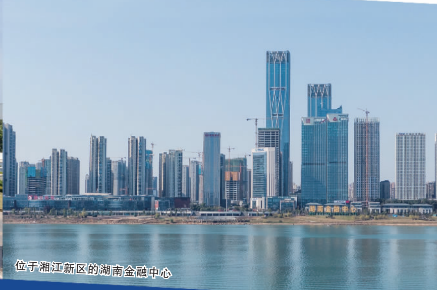
位于湘江新区的湖南金融中心