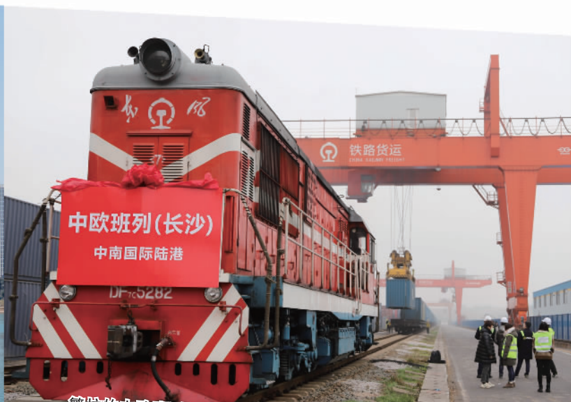
繁忙的中欧班列(长沙)