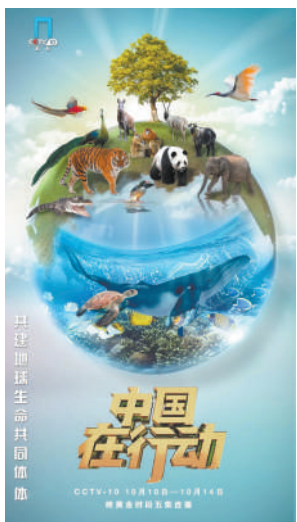
《中国在行动》节目海报。