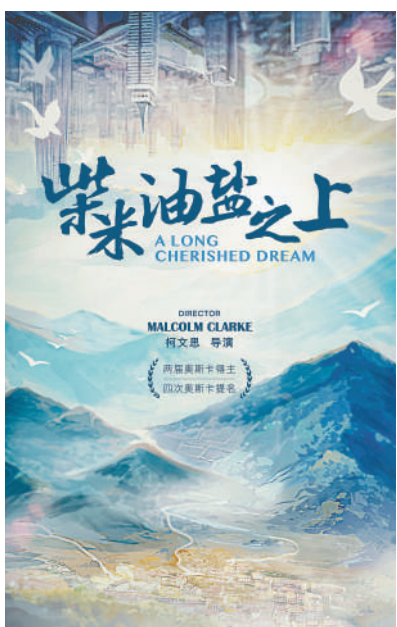
图为纪录片《柴米油盐之上》海报。