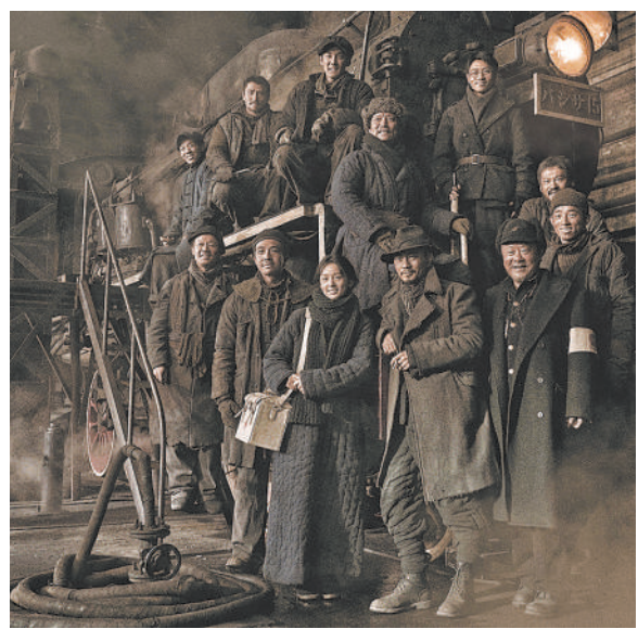
图为电影《铁道英雄》剧照。

近日,电影《铁道英雄》在全国上映。电影讲述抗日战争时期鲁南临城“铁道游击队”与敌人斗智斗勇并取得最终胜利的故事,是中国共产党领导的抗日武装英勇作战、成为全民抗战中流砥柱的一个缩影。在庆祝建党百年之际,这样一部书写英雄、彰显家国情怀的电影上映,恰逢其时。