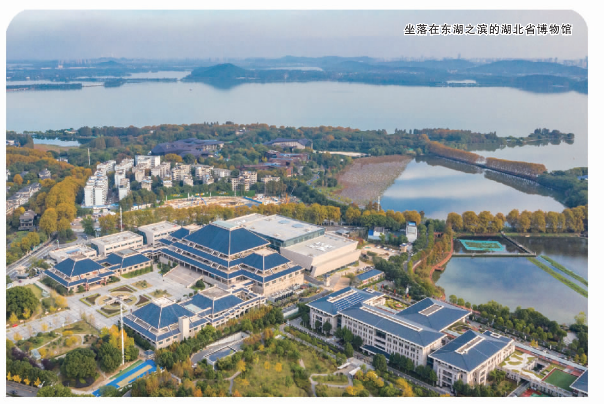
坐落在东湖之滨的湖北省博物馆