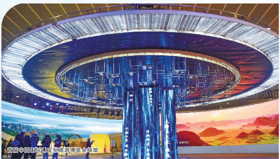
首届中国(武汉)文化旅游博览会会场