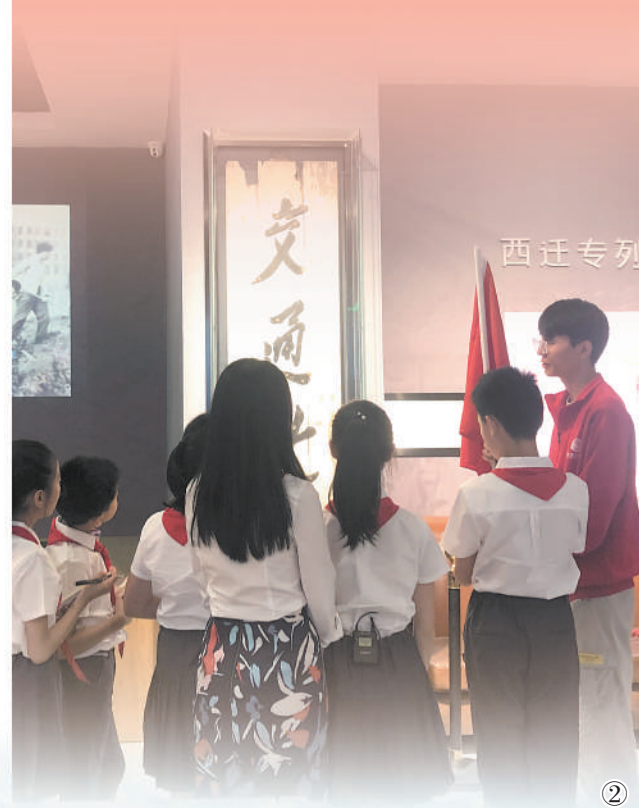
图②：学生参观交大西迁博物馆。