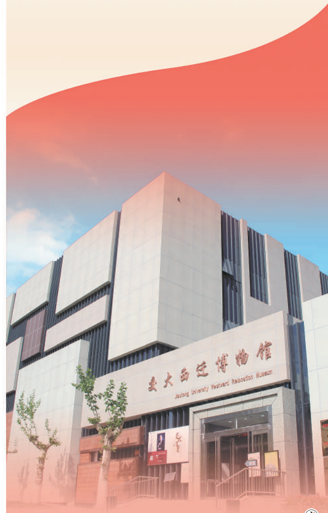
图①：交大西迁博物馆外景。