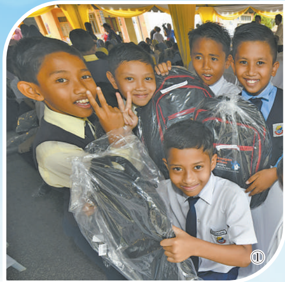
“高温天气即将到来，今天我们向同学们讲解一些夏日防火的注意事项”“斋节就要到了，我们为大家带来了一些节日食品和文体用品，提前祝大家节日快乐”……

中国企业在走向海外市场的过程中，积极推动当地教育事业的发展，通过援建学校、提供图书教具、设立奖学金等方式，让许多家庭贫困的孩子实现了读书的梦想，为增进当地民生福祉作出贡献。