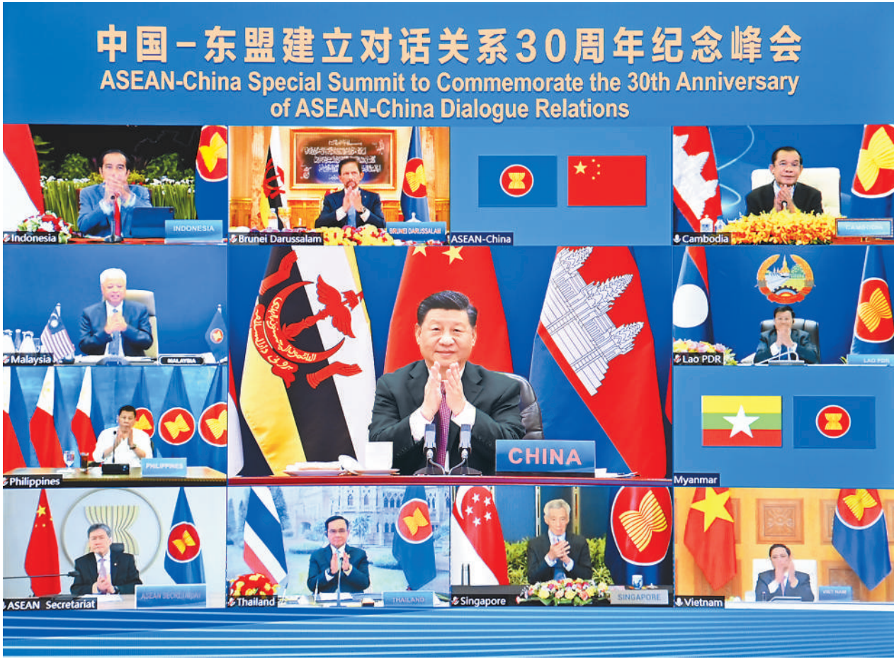
11月22日上午,国家主席习近平在北京以视频方式出席并主持中国—东盟建立对话关系30周年纪念峰会,发表题为《命运与共 共建家园》的重要讲话。中国东盟正式宣布建立中国东盟全面战略伙伴关系。

本报北京11月22日电 (记者王迪)国家主席习近平22日上午在北京以视频方式出席并主持中国—东盟建立对话关系30周年纪念峰会。中国东盟正式宣布建立中国东盟全面战略伙伴关系。