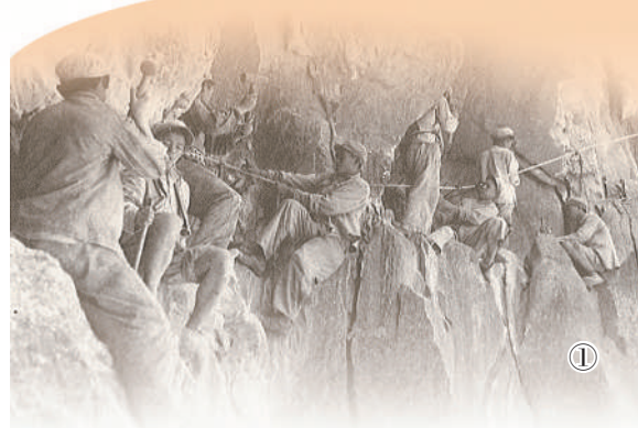
四川公路设计院“寻路人”