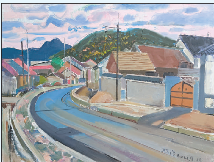
小瀛洲之沙尖子(油画)