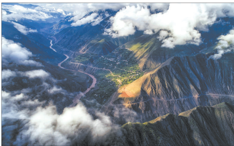
图①:西藏自治区芒康县曲孜卡乡的澜沧江大峡谷,江边是村庄与盐田。 图②:青海省玉树藏族自治州囊谦县,澜沧江上游扎曲河的网状水系。 图③:西藏自治区昌都市,扎曲河与昂曲河在这里汇流成为澜沧江。 图④:西藏自治区类乌齐县长毛岭国家级马鹿自然保护区,国家二级保护动物马鹿在悠闲觅食。 图⑤:穿过澜沧江峡谷的滇藏公路。 图⑥:青海省玉树藏族自治州囊谦县,澜沧江上游的湿地。

习近平总书记强调,要把三江源保护作为青海生态文明建设的重中之重,承担好维护生态安全、保护三江源、保护“中华水塔”的重大使命。 澜沧江发源于青海省,流经西藏、云南等地,穿过多类生态环境与物种栖息地,是三江源河流体系的重要组成部分。澜沧江流域也是雪豹、滇金丝猴、长臂猿等濒危野生动物的家园,分布着红豆杉、望天树等濒危植物,使得澜沧江成为生物多样性最丰富的河流之一。 近年来,澜沧江沿线各省区切实加强生态保护力度,流域野生动植物种群数量明显增多,栖息环境得到显著改善,流域内天然水生生物资源得到恢复性增加。目前,澜沧江出青海断面水质稳定在Ⅰ类,澜沧江上游草地、林地覆盖率显著提高,人与自然和谐共生的绿色发展方式正在澜沧江流域生动实践。