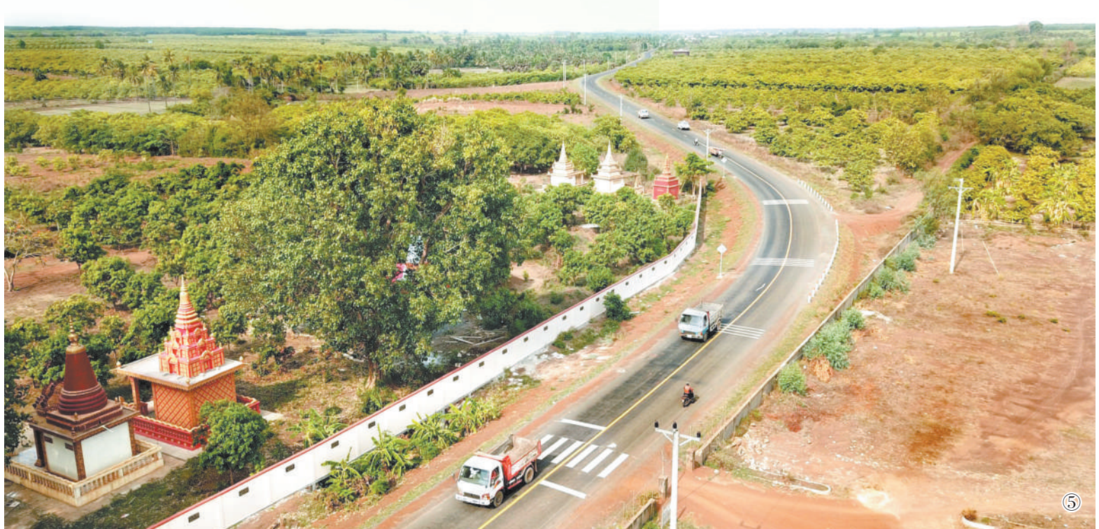
图①：联合国世界粮食计划署驻华代表屈四喜（左二）在甘肃省调研富岭马铃薯小农户试点项目。图②：中国专家在布隆迪调研山区稻瘟病情况。图③：在青海省西宁市湟中区，当地残疾妇女参加由农发基金与政府合作资助的非农生技能培训项目中的传统刺绣培训。图④：2020年10月，中国援柬减贫示范合作技术援助项目的饮水工程完工。图为当地村民向记者展示清洁的自来水。图⑤：位于柬埔寨磅省的中国援柬乡村道路项目。