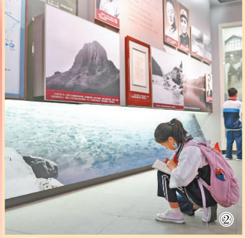
图②:一名学生在贵州仁怀市茅台镇红军长征过茅台陈国珍故居抄录红色故事。