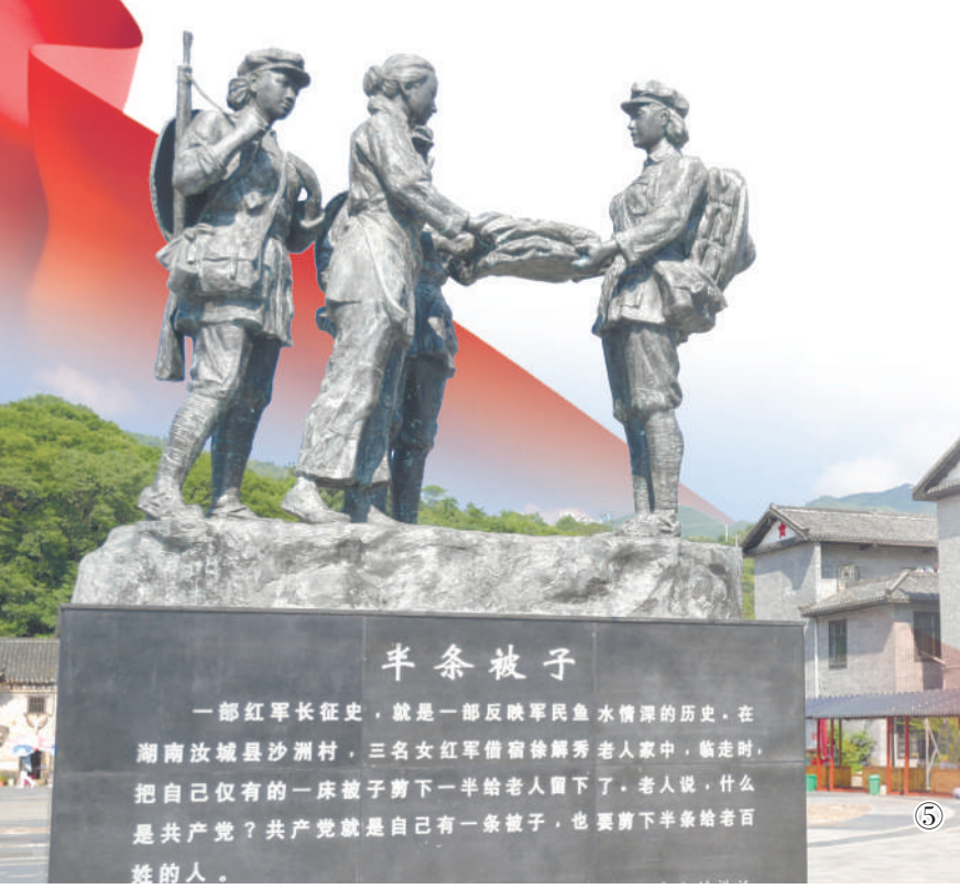
一部红军长征史,就是一部反映军民鱼水情深的历史。在湖南汝城县沙洲村,三名女红军借宿徐姓男主人家中,临走时,把自己仅有的一床被子剪下一半给老人盖下了。老人说,什么是共产党?共产党就是自己有一条被子,也要剪下半条给老百姓的人。