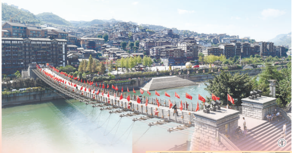
图①:贵州仁怀市茅台镇茅台渡口铁索桥。

既要建设好,也要利用好。“未来,长征国家文化公园如何充分发挥爱国主义教育作用,做到文旅融合,带动百姓致富,从而实现经济效益和社会效益的双赢,还要逐步探索,这是一项长期工程。”贵州省长征国家文化公园协调指导处负责人表示。