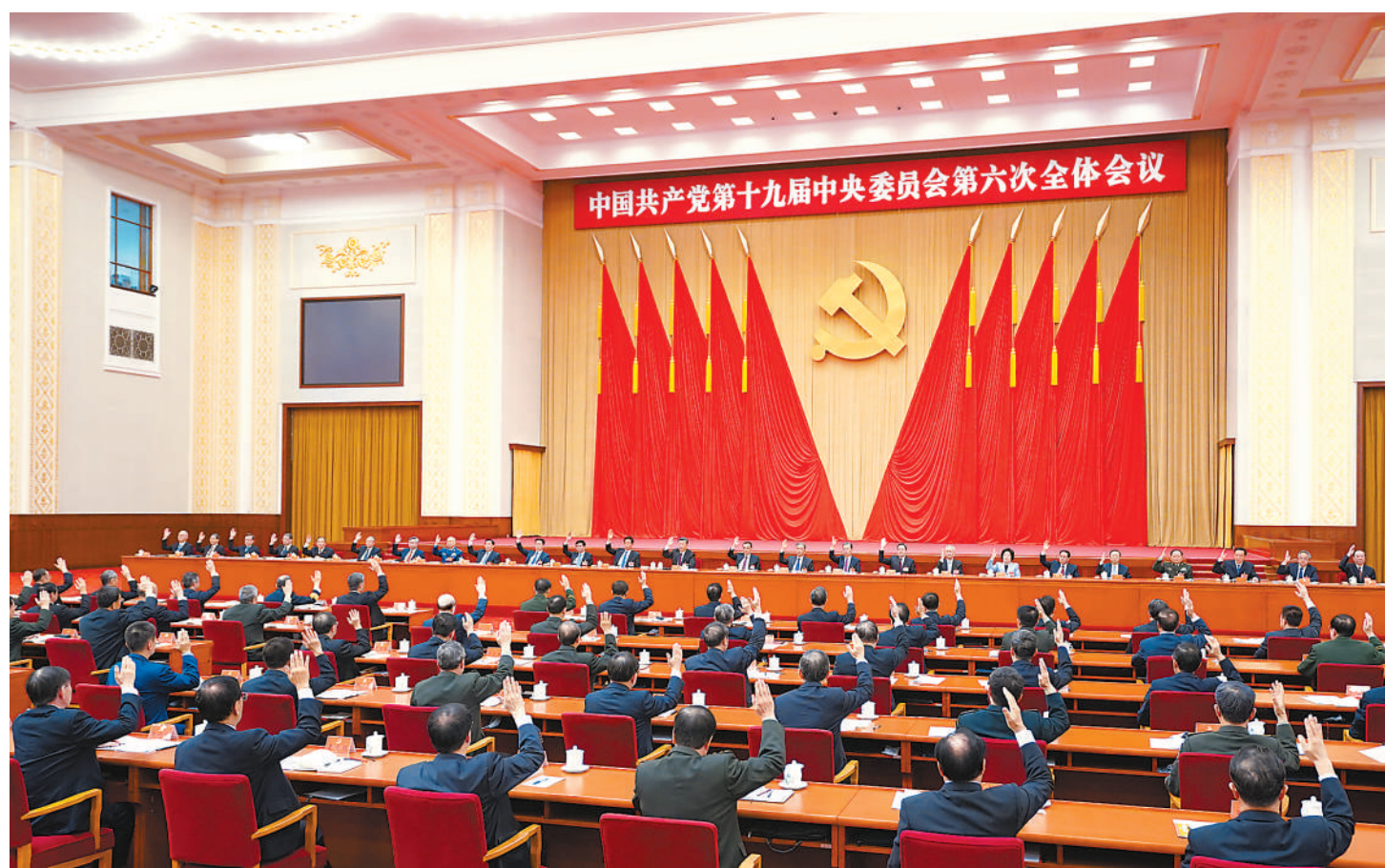
中国共产党第十九届中央委员会第六次全体会议,于2021年11月8日至11日在北京举行。中央政治局主持会议。新华社记者 燕雁摄

新华社北京11月11日电 中国共产党第十九届中央委员会第六次全体会议公报 (2021年11月11日中国共产党第十九届中央委员会第六次全体会议通过) 中国共产党第十九届中央委员会第六次全体会议,于2021年11月8日至11日在北京举行。 出席这次全会的有,中央委员197人,候补中央委员151人。中央纪律检查委员会常务委员会委员和有关方面负责同志列席会议。党的十九大代表中部分基层同志和专家学者也列席会议。 全会由中央政治局主持。中央委员会总书记习近平作了重要讲话。 全会听取和讨论了习近平受中央政治局委托作的工作报告,审议通过了《中共中央关于党的百年奋斗重大成就和历史经验的决议》,审议通过了《关于召开党的第二十次全国代表大会的决议》。习近平就《中共中央关于党的百年奋斗重大成就和历史经验的决议(讨论稿)》向全会作了说明。 全会充分肯定党的十九届五中全会以来中央政治局的工作。一致认为,一年来,世界百年未有之大变局和新冠肺炎疫情