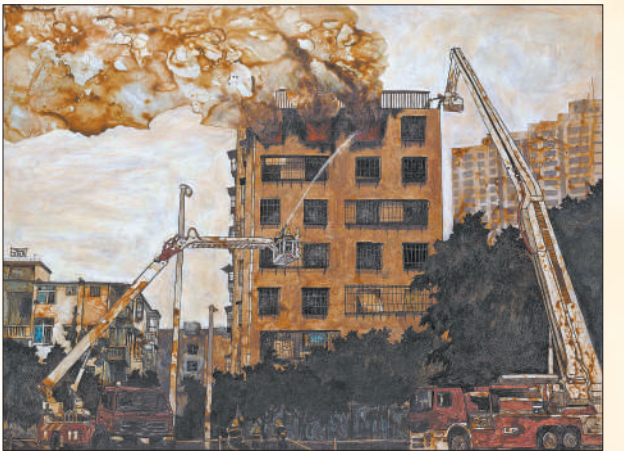
▲家园守护者(水彩) 梁中瀚