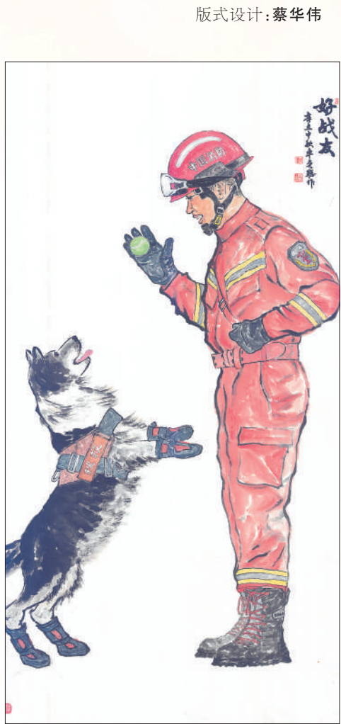
▲好战友(中国画) 车奕聪