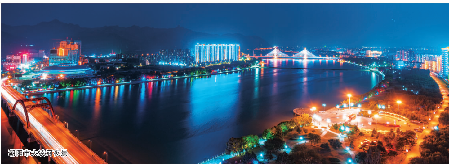
朝阳市大凌河夜景