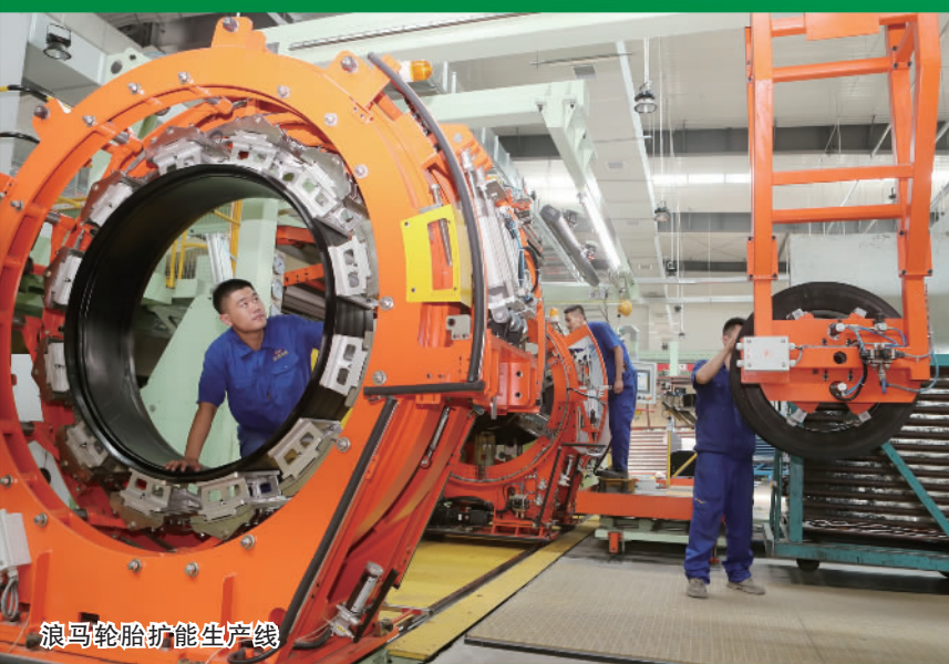
浪马轮胎扩能生产线

站在“两个一百年”奋斗目标历史的交汇点上，辽宁省朝阳市立足新发展阶段，贯彻新发展理念，构建新发展格局，推动高质量发展，紧紧围绕实现“六个显著提升”奋斗目标，强力推进“四个转化”，加快实现“七个突破”，奋力开启朝阳高质量发展新征程。