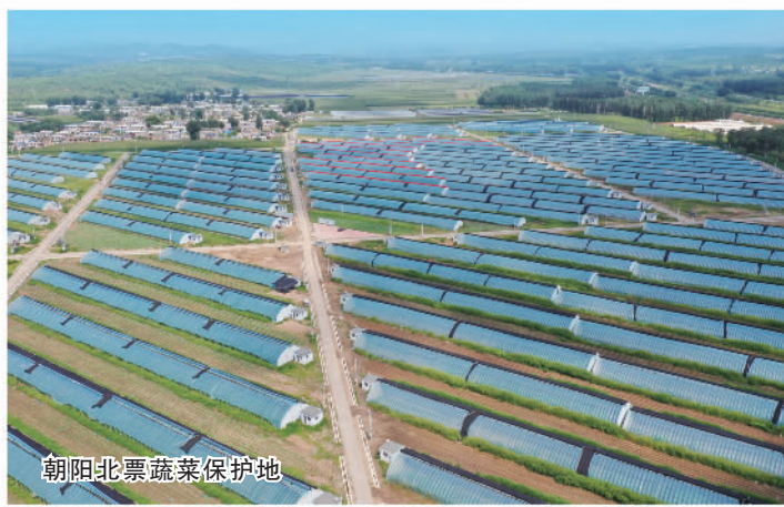
朝阳市北票蔬菜保护地

开启朝阳高质量发展新征程，把区位优势转化为承接优势。 朝阳处于京津冀和东北地区的联接地带，是两大区域互联互通的重要