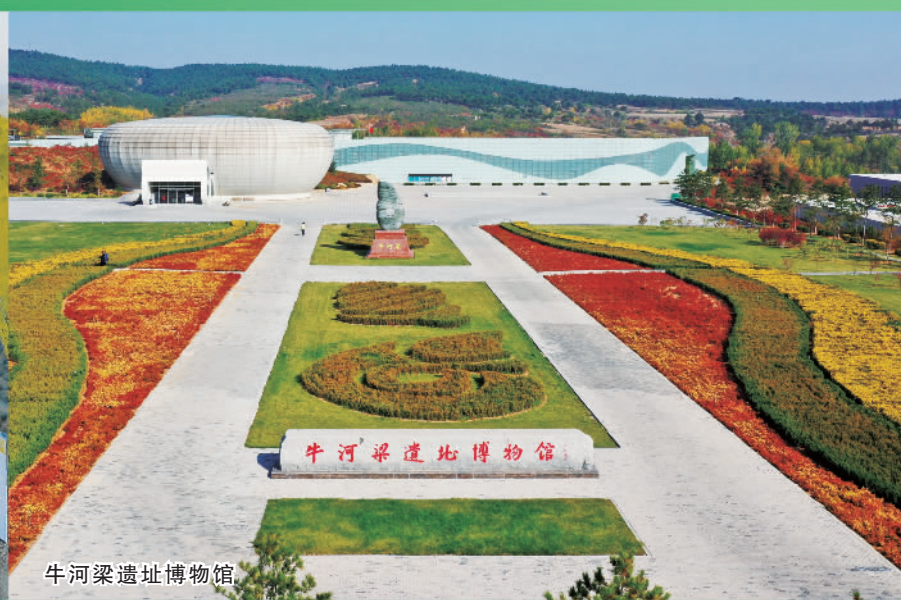
牛河梁遗址博物馆

经过全市上下共同努力，辽宁省朝阳市圆满完成“十三五”时期的主要任务，实现“十四五”良好开局。未来5年，是朝阳实现高质量发展的关键五年。站在新的起点，朝阳市坚持科学研判朝阳发展的阶段性特征，抢抓机遇，激流勇进，坚定不移地沿着高质量发展的路子走下去，始终保持“一张蓝图绘到底”的战略定力，努力实现综合实力显著提升、发展质量效益显著提升、城乡建设品质显著提升、民生保障能力显著提升、社会治理效能显著提升、党的建设水平显著提升，奋力开创朝阳高质量发展新局面。