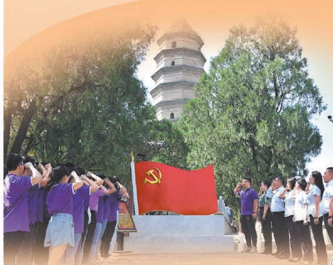
图①：陕西省延安市宝塔山上，党员们重温入党誓词。

2012年，这栋土坯房被列为于都县文物保护单位。于都县近年来先后投入1500多万元，对全县现存的1700余条红军标语开展普查、保护，并设立红军标语集中展示馆，作为革命传统教育的鲜活教材。