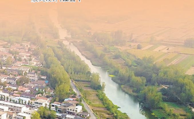
本版统筹：卞民德 本版责编：叶琦 王莹欣 版式设计：汪哲平