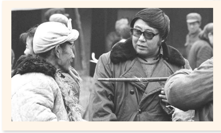
路遥与陕北农民交谈。