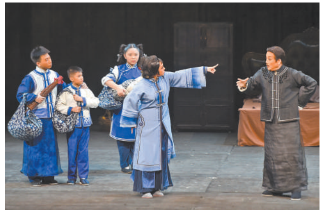
图为京剧《母亲》演出现场。

对现代戏曲而言,现代性和戏曲化是不可或缺的一体两面,现代性是为了牢固建立戏曲与现实社会的密切关联,戏曲化才能确保现代戏曲始终行进在中华文明的发展轨道上。昆剧以及其他戏曲艺术的传承创新表明,真正意义上的戏曲现代性一定是从中华民族的戏曲传统根脉上有机生长出来的,是基于传统的现代性,必然要以“内生的现代性”为显著特征。努力接续、全面继承戏曲文化优良传统,让戏曲始终保持切合其自身规律与特色的发展方向,才是戏曲现代性的成功之道。