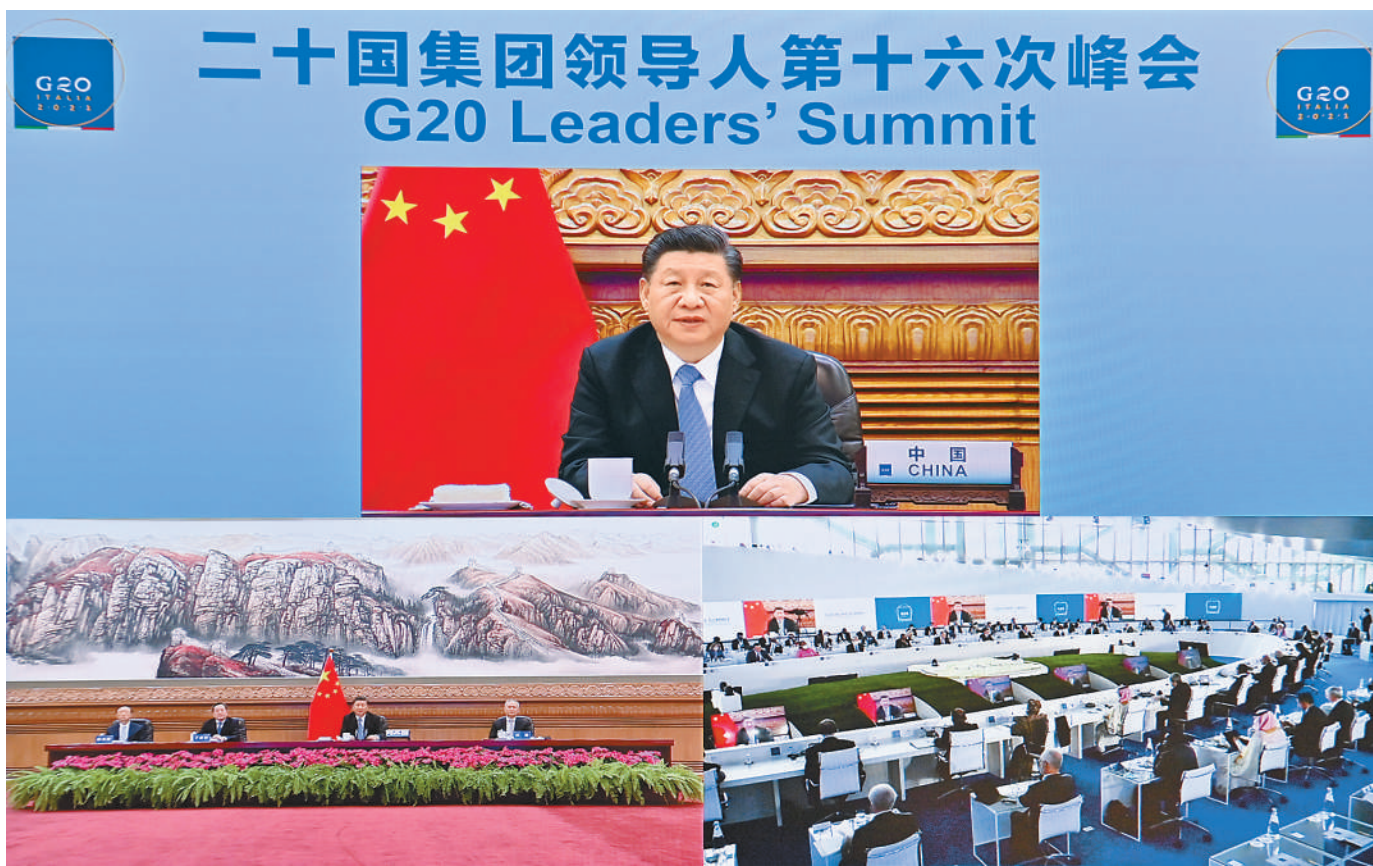
10月31日晚,国家主席习近平在北京继续以视频方式出席二十国集团领导人第十六次峰会。

■ 气候变化和能源问题是当前突出的全球性挑战,事关国际社会共同利益,也关系地球未来。国际社会合力应对挑战的意愿和动力不断上升,关键是要拿出实际行动。第一,采取全面均衡的政策举措。必须统筹环境保护和经济发展,兼顾应对气候变化和保障民生,主要经济体应该就此加强合作。第二,全面有效落实《联合国气候变化框架公约》及其《巴黎协定》。要坚持联合国主渠道地位,以共同但有区别的责任原则为基石,以国际法为基础,以有效行动为导向,强化自身行动,提升合作水平。第三,加大对发展中国家支持力度。二十国集团成员应该率先促进先进技术推广运用,发达国家也要切实履行承诺,为发展中国家提供资金支持