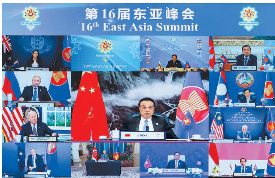
10月27日晚,国务院总理李克强在北京人民大会堂出席第16届东亚峰会。会议以视频形式举行。

本报北京10月28日电 (记者白阳)国务院总理李克强27日晚在人民大会堂出席第16届东亚峰会。东盟国家领导人以及俄罗斯总统普京、韩国总统文在寅、美国总统拜登、日本首相岸田文雄、印度总理莫迪、澳大利亚总理莫里森、新西兰总理阿德恩等与会。文莱苏丹哈桑纳尔主持会议。会议以视频形式举行。