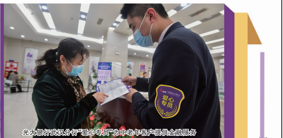
光大银行武汉分行“爱心专员”为中老年客户提供金融服务