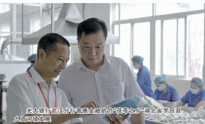
光大银行武汉分行普惠金融助力“茯苓之乡”湖北省罗田县九资河镇发展