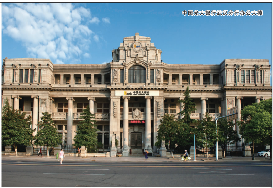
中国光大银行武汉分行办公大楼