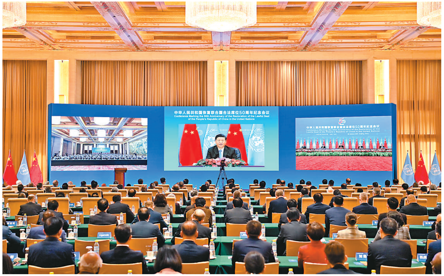
10 月 25 日,国家主席习近平在北京出席中华人民共和国恢复联合国合法席位 50 周年纪念会议并发表重要讲话。

新华社北京 10 月 25 日电 国家主席习近平 25 日在北京出席中华人民共和国恢复联合国合法席位 50 周年纪念会议并发表重要讲话。习近平强调,新中国恢复在联合国合法席位以来的 50 年,是中国和平发展、造福人类的 50 年。中国将坚持走和平发展之路,始终做世界和平的建设者;坚持走改革开放之路,始终做全球发展的贡献者;坚持走多边主义之路,始终做国际秩序的维护者。中国愿同各国秉持共商共建共享理念,弘扬全人类共同价值,践行真正的多边主义,站在历史正确的一边,站在人类进步的一边,为实现世界永续和平发展、为推动构建人类命运共同体而不懈奋斗。(讲话全文见第二版) 中共中央政治局常委、中央书记处书记王沪宁出席会议。