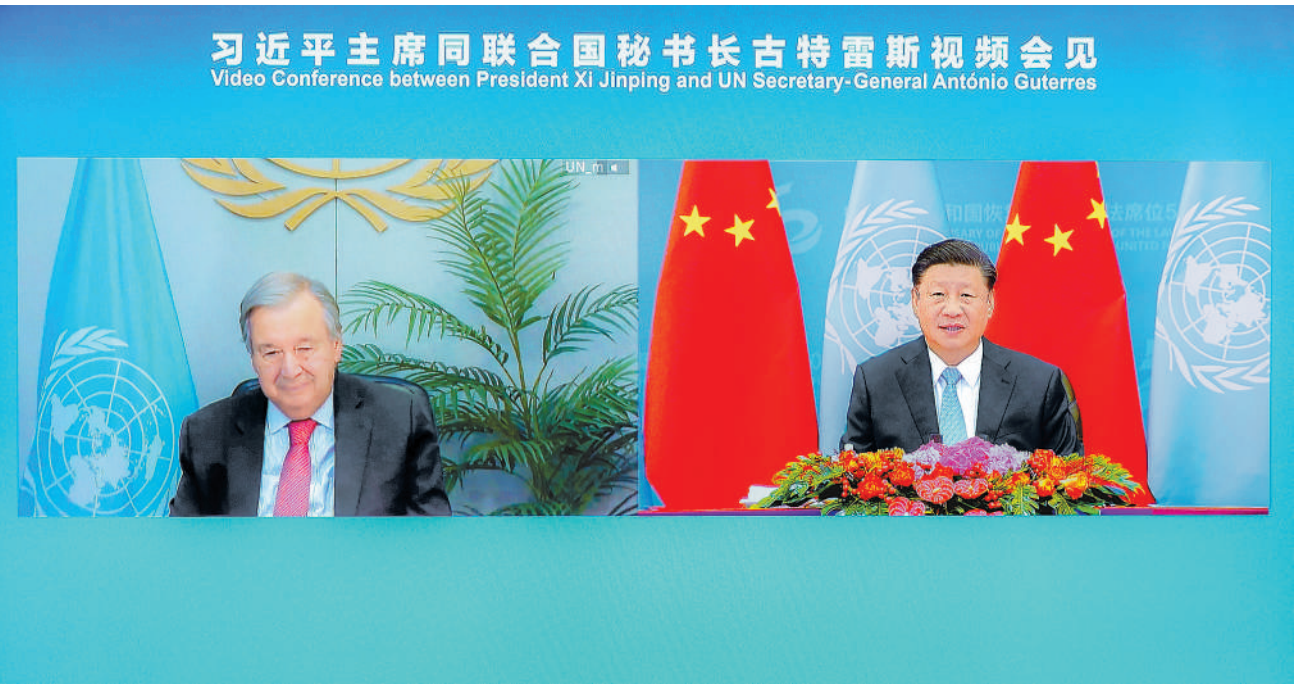
10 月 25 日上午,国家主席习近平在北京人民大会堂以视频方式会见联合国秘书长古特雷斯。

新华社北京 10 月 25 日电 国家主席、书记王沪宁参加会见。习近平指出,今天是新中国恢复在联合国合法席位 50 周年。中国举办纪念会议,既是为了回顾中国和联合国共同走过的不平凡历程,也是为了从新的历史起点出发,携手打造更加美好的世界。习近平强调,历史一再证明,无论一个国家多么强大, (下转第三版)