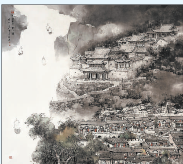
《构建中国（九曲黄河第一镇·碛口）》。