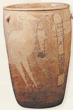
2021年10月,仰韶村遗址的考古发掘标志着中国现代考古学的诞生。

中国有坚定的道路自信、理论自信、制度自信,其本质是建立在五千多年文明传承基础上的文化自信。百年中国考古坚定我们的文化自信。一生择一事,一事终一生。回顾辉煌的100年,展望更加灿烂的未来,考古人信心满满。