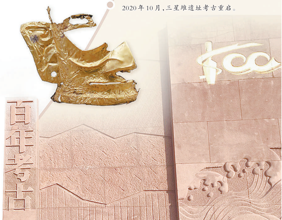
2020年10月,三星堆遗址考古重启。