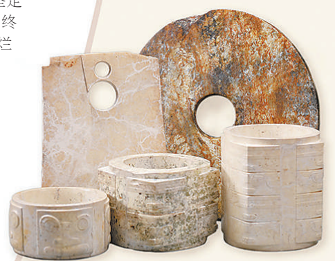
2007年底,良渚古城被发现。