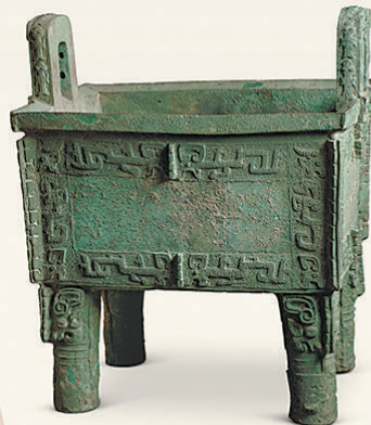
1928年—1937年,殷墟共进行了15次大规模的考古发掘。