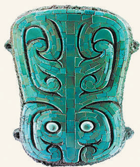
1959年夏,二里头遗址拉开了夏文化探索的序幕。